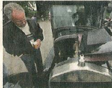
Ein alter Ford aus den 1940ern zeigt sein Innenleben.