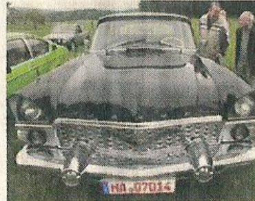
Dunkel wie ein Mafiawagen. Der russische SIM GAZ.