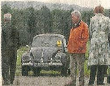
Entspannt gucken: der VW Käfer mit den Schlafaugen.

Youngtimer. Unter die Bezeichnung Oldtimer fallen auch Motorräder, Lastwagen, Busse oder Traktoren. Der Zustand muss dabei nicht restauriert sein. Auch Wagen, die im Originalzustand belassen sind, zählen zu den Oldtimern.