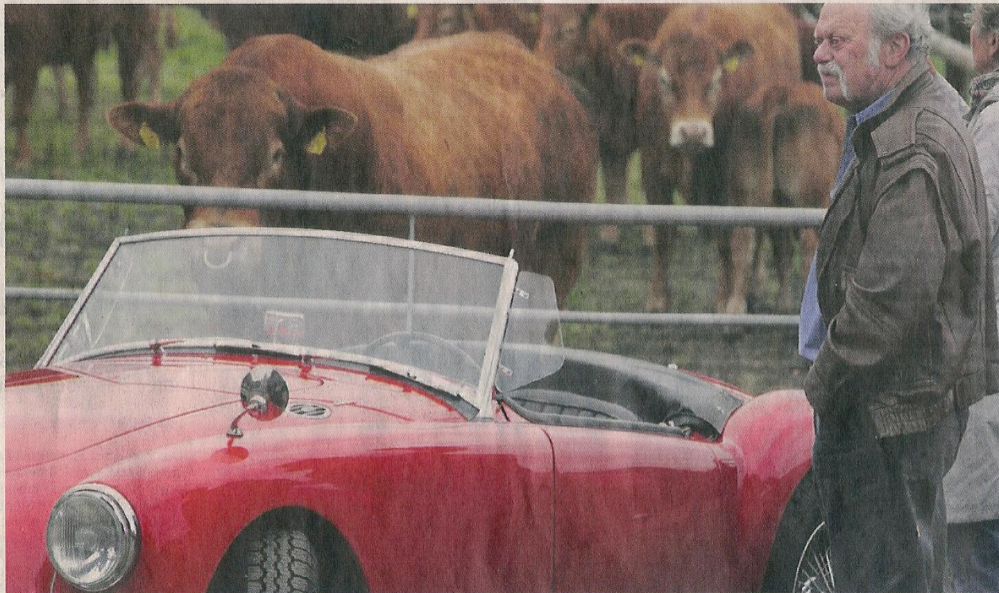
Den roten MG bestaunen nicht nur die vielen Besucher auf Hof Hegemann. Auch der Bulle wirft einen interessierten Blick auf den Oldtimer.

Der Motorsportclub Sprockhövel veranstaltete am Sonntag das fünfte Oldtimertreffen bei Hegemann. 200 alte Schätzchen ließen es auf Hof und Wiesen blitzen. Prämien für älteste Fahrzeuge und weiteste Anreise