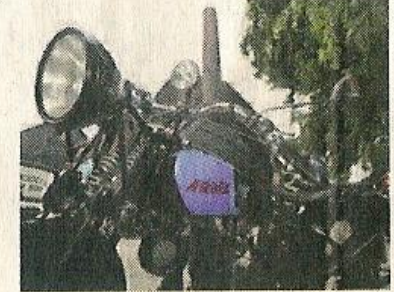
Eine 76 Jahre alte Ardie. Ganze 10 PS leistet der Motor.